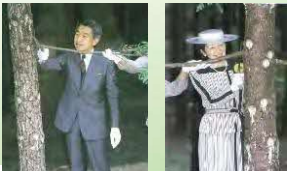
皇太子・同妃殿下(同会場)