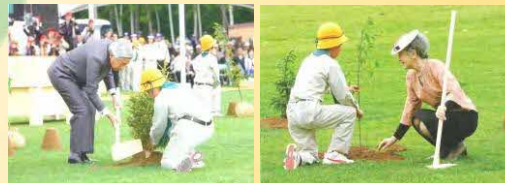
天皇・皇后両陛下(苫小牧)