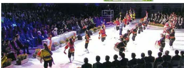
沖縄県[令和元年]での様子